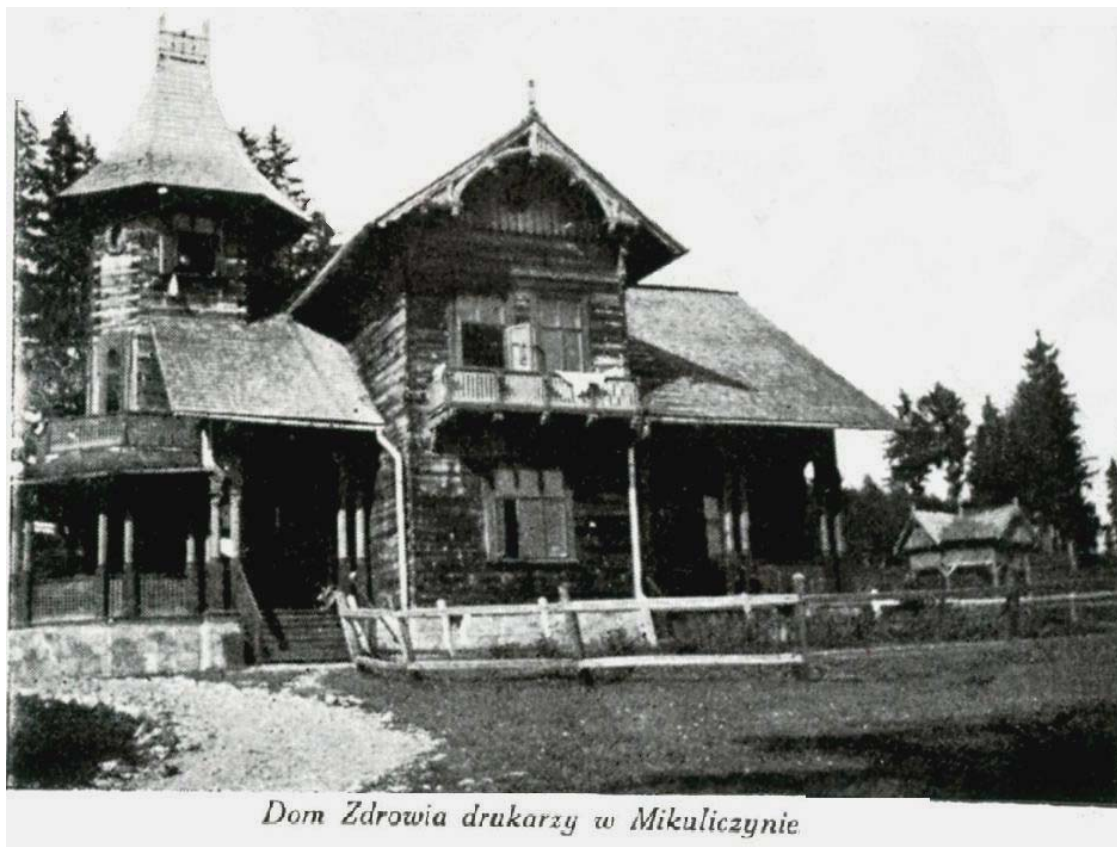
Рис. 4. Відпочинково-оздоровчий будинок професійної спілки львівських поліграфістів у Микуличині, 1910 р.

Урочисте відкриття здравниці відбулося 15 травня 1910 р. [20].